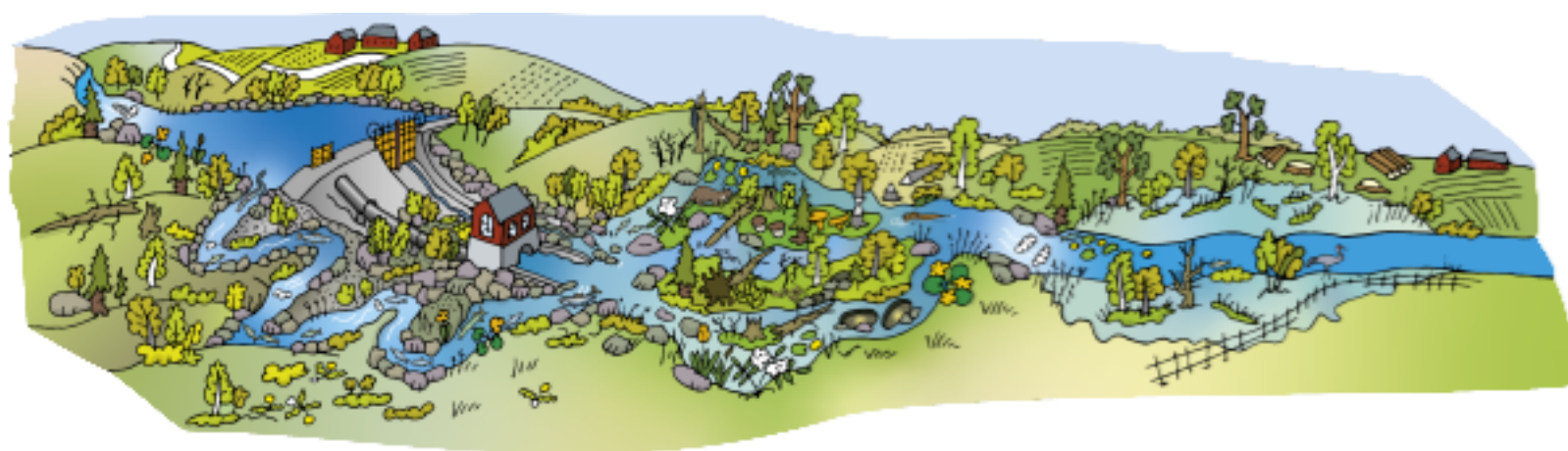
Illustration: Dietmar Kämmerling

Vi har jobbat med en mängd olika projekt, hela 16 stycken. Några av projekten är en del av satsningen inom naturtillsyn där tre projektledare jobbat med gröna projekt kopplat till naturtillsyn. Vi har lanserat en fälthandbok om invasiva främmande arter som fått ett jättestort genomslag och för första gången arbetar vi med ett regeringsuppdrag tillsammans med en rad centrala myndigheter. Vi har fått träffas igen efter corona, vilket underlättat vårt arbete och inte minst gjort det mycket trevligare. Vi syns oftare i och med vårt nyhetsbrev och vi är flitiga på LinkedIn. Vi är involverade i olika projekt som är kopplade till den nationella tillsynsstrategin och fokusområdet naturtillsyn, till exempel har vi drivit en nationell tillsynskampanj kopplad till påverkan på naturvärden i grunda havsvikar. Ja, listan kan göras väldigt lång över vad vi har åstadkommit under året. Tack till alla er som varit och är engagerade på olika sätt i Miljösamverkan Sverige, tillsammans gör vi ett riktigt bra jobb!