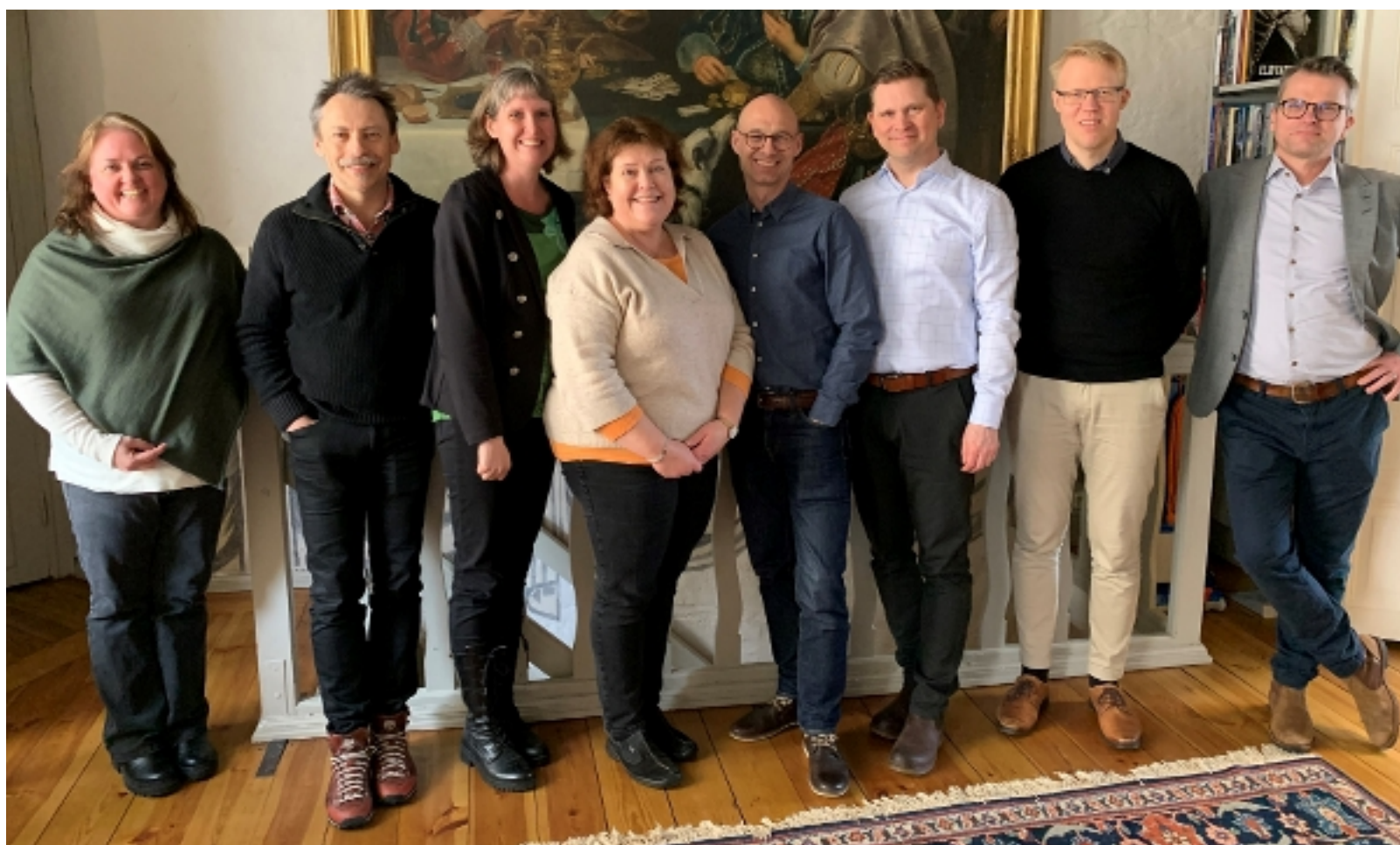
Miljösamverkan Sveriges styrgrupp.

Den 2 maj presenterar vi resultaten från projektet under ett webinarium för länsstyrelserna.