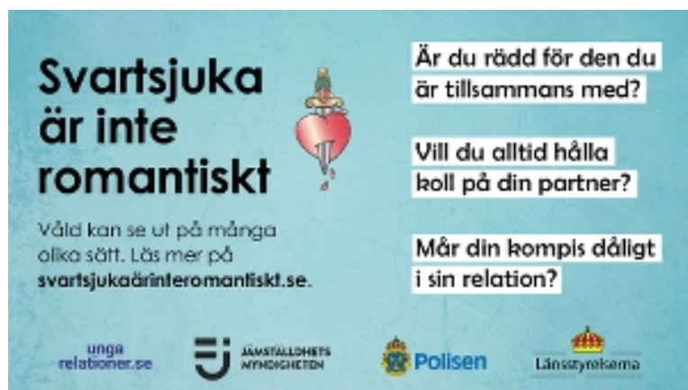
Svartsjuka är inte romantiskt

I budgetpropositionen presenterar regeringen flera satsningar för att möjliggöra en reform av socialtjänsten, med en ny socialtjänstlag. Under 2024 ska en ny socialtjänstlag presenteras och arbetet påbörjas för en omställning till en långsiktigt hållbar, mer förebyggande och kunskapsbaserad socialtjänst. Som en del i satsningen har regeringen avsatt medel till en kompetens- och bemanningssatsning i socialtjänsten samt en överenskommelse med SKR för att stödja kommunerna i omställningen. En utredning kommer också tillsättas för att föreslå ett samlat regelverk för socialtjänstdataregister. Syftet är att skapa bättre förutsättningar för socialtjänsten att arbeta kunskapsbaserat.