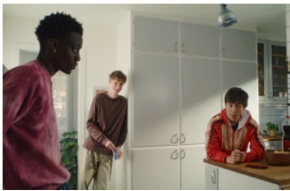
Låt inte tystnaden tala

Webbutbildningarna är kostnadsfria. Mer information om utbildningspaketet och länkar till de olika delarna finns på mucf.se/rattattveta .