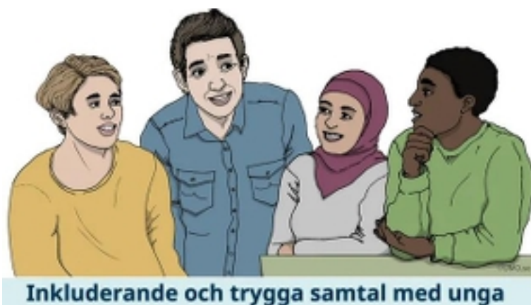
Inkluderande och trygga samtal med unga Inkluderande och trygga samtal med unga - MUCF

Rätt att veta! - Sexuell och reproduktiv hälsa och rättigheter är en fördjupning i ämnet och består av en föreläsning i tre delar.