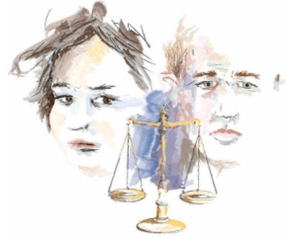
Illustratör: Danny Eriksson

Förslaget till jämställdhetsstrategi är nu ute på remiss hos kommuner, myndigheter, regionen, lärosäten och civilsamhället i Västra Götaland. Remissvaren kommer att beaktas i arbetet med att färdigställa strategin och den nya länsstrategin kommer finnas tillgänglig för aktörer i länet i slutet av februari 2024.