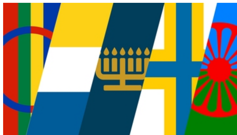
Illustration: Kungliga biblioteket