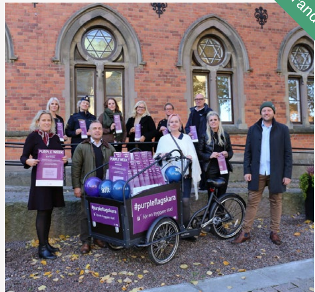
Genom Purple Flag-processen ökas tryggheten i Skaras stadskärna. Målsättningen är att arbetet ska utmynna i att stadskärnan blir Purple Flag-certifierad.

– Alla gynnas vi av en attraktiv och trygg stad och därför är det avgörande att vi inom näringsliv och