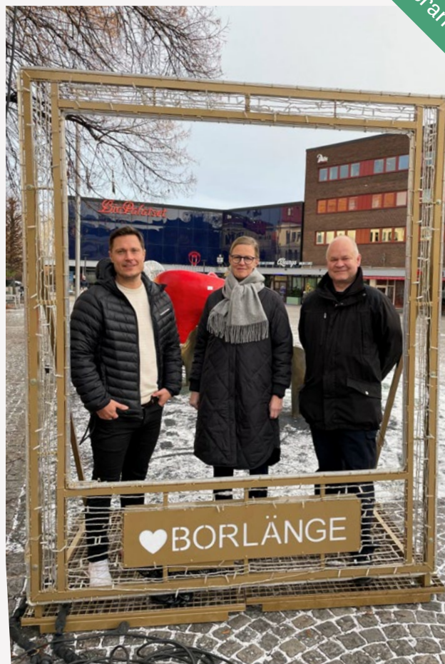
Under de senaste två åren har Borlänge bland annat arbetat med modellen Business Improvement District.

– Där ser vi att vi har kommit en bra bit på